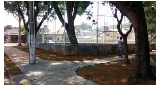
Quadra esportiva da Rua Malaquias, no Jaraguá, recebeu novas traves e telas de proteção.