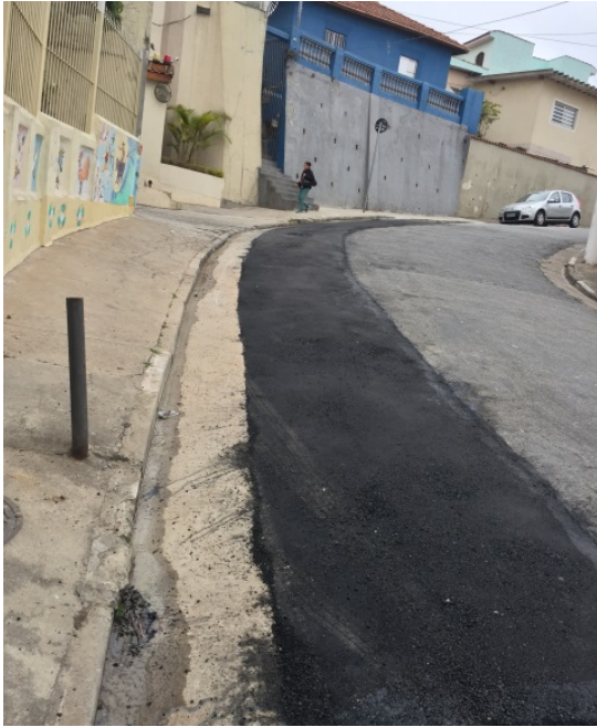
Recuperação da sarjeta da Rua Salvador Sala, no Piqueri.