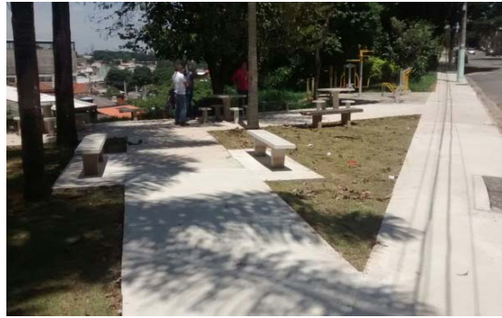
Revitalização da Praça Irmã Nelsa Starfuzza, no Jardim Mutinga: instalação de corrimão, equipamentos de ginástica, bancos e mesas de concreto.