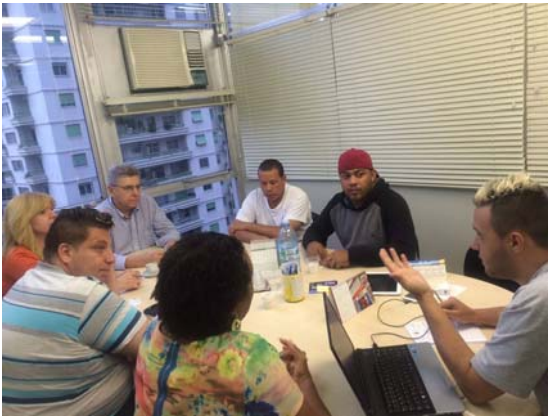
Com Associação Rolezinho, visita ao gabinete para tratar do PL 'Lança-perfume mata'.