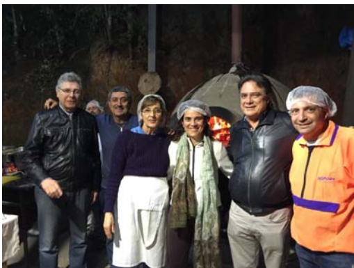
Noite da Pizza na Aliança de Misericórdia