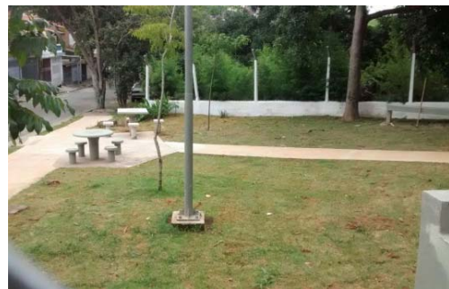
Praça na Rua Malaquias Ferreira Leal, no Jaraguá, recebeu equipamentos de ginástica, além de bancos e mesas de concreto.