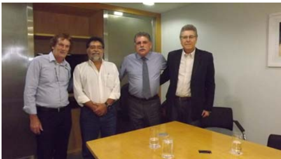
Em visita ao DAEE (Departamento de Águas e Energia Elétrica do Governo Estadual) para tratar do Córrego do Ribeirão Vermelho.