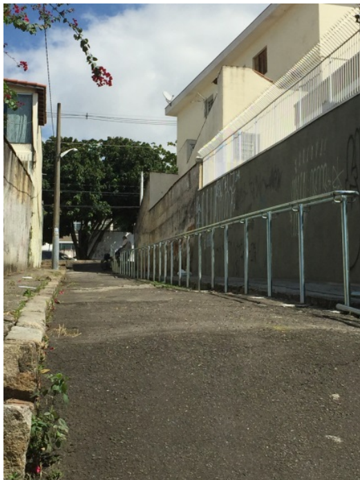
Instalação de corrimão na altura do nº 522 da Rua Genésio Arruda, em Pirituba.