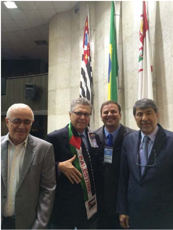
Recebendo o Cônsul da Palestina na Câmara Municipal de SP.