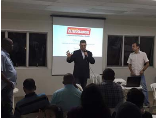
Ouvindo e apresentando propostas para Pirituba e região.