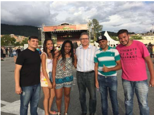
Nas comemorações do Dia da Consciência Negra