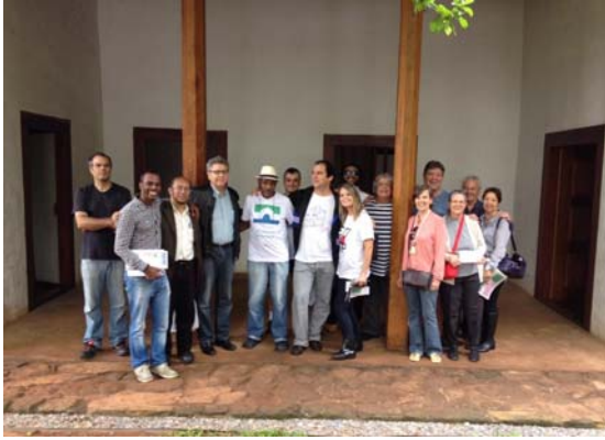
'Abraço' à Casa Bandeirista do Itaim Bibi, reivindicando sua abertura ao público.