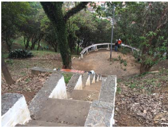
Reforma da Praça Amadeu Decome, na Lapa: instalação de iluminação e adequação de passeio, além de colocação de mesas e bancos de concreto. Eliseu Gabriel avalia com o movimento de moradores do local a possibilidade de construir um anfiteatro ao ar livre.