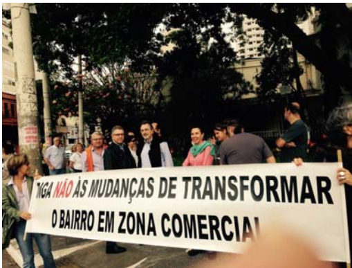
Junto aos moradores do entorno da Rua Estados Unidos.