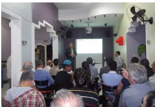
Com os moradores do Parque São Domingos.