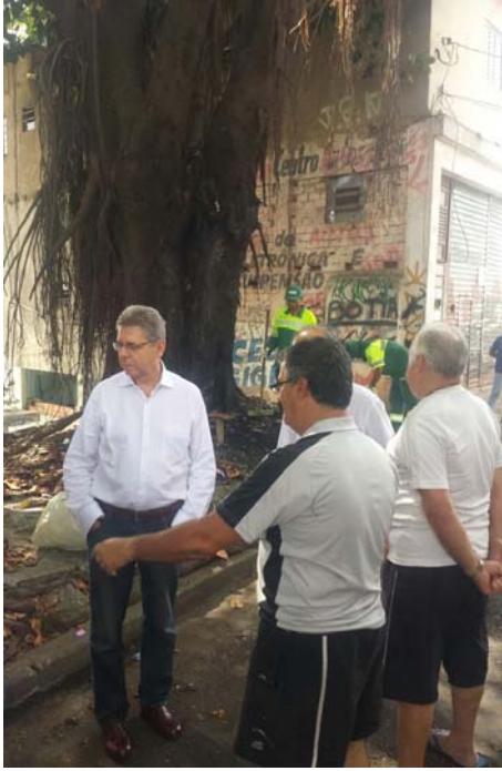
Acompanhando o mutirão da limpeza no Jardim Marisa.