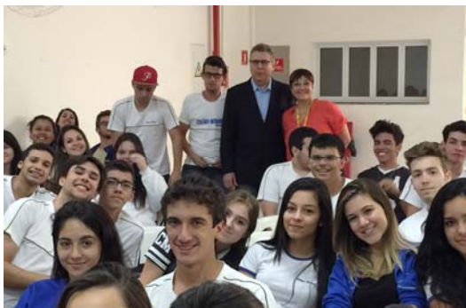
Palestra para alunos do Colégio Miranda.