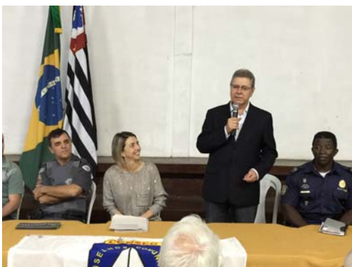
Participação na reunião mensal do Conseg Taipas|Jaraguá.