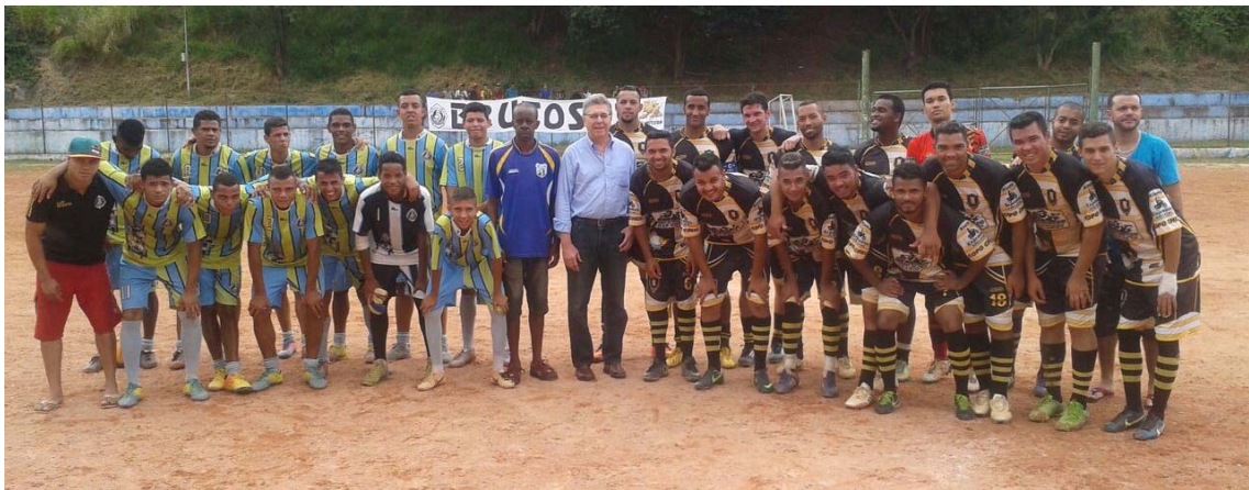
Apoio ao esporte e ao Festival Comemorativo Dia do Índio, no CDC Jardim Líbano.