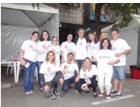
Dia Mundial dos Animais (04/10/15).