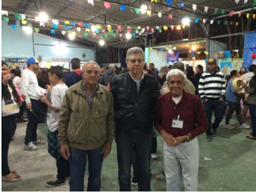
Quermesse na Flamarion