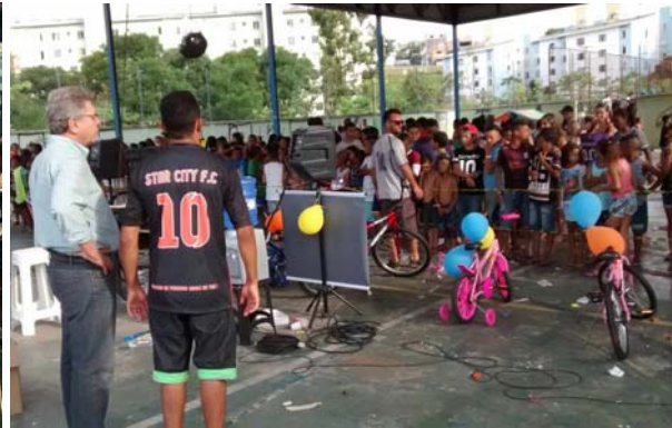
Apoio ao evento do Dia das Crianças no City Jaraguá