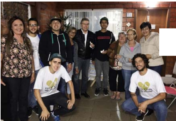
Com moradores do Residencial Vista Verde, em Pirituba, para a implantação de uma pista de skate na praça localizada à Rua Desembargador Manuel Carlos Costa Leite.