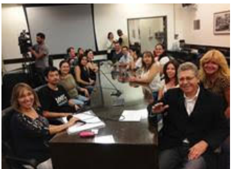
Reunião mensal do Fórum de Proteção Animal.