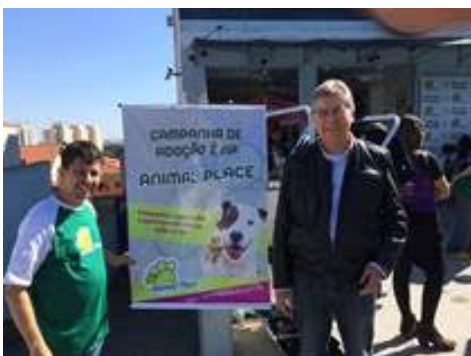
Feira de adoção animal em Pirituba.