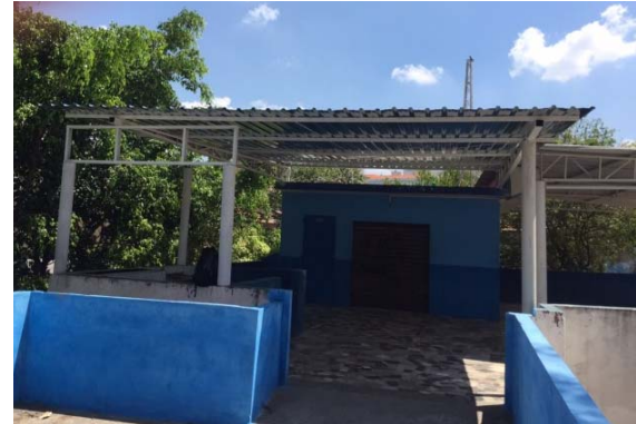
CDC Jardim Líbano: obras concluídas no alambrado e no telhado.