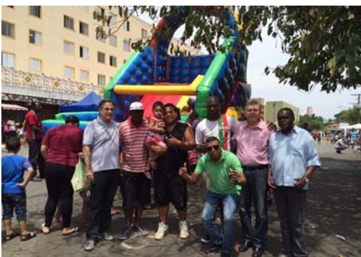
Na Cohab Taipas.