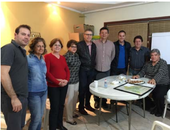
No Condomínio Recanto Anastácio.