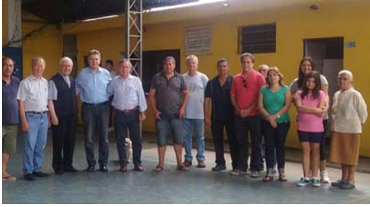
E na Comunidade Cristo Salvador.