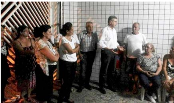
No Jardim Cidade Pirituba.