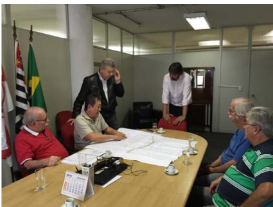
Reunião em Siurb (Secretaria de Infraestrutura Urbana) com moradores da Av. Elísio Teixeira, para tratar da problemática das enchentes na região