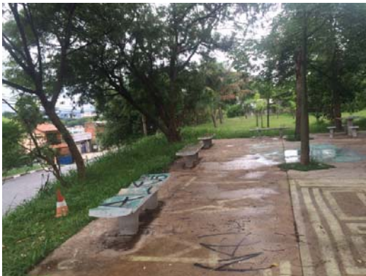
Manutenção, adequação e ampliação da Praça Fioravante Prando, na Lapa.