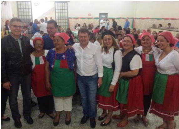
Sempre parceiro do almoço beneficente na Paróquia Nossa Senhora Aparecida, na Vila Piauí.