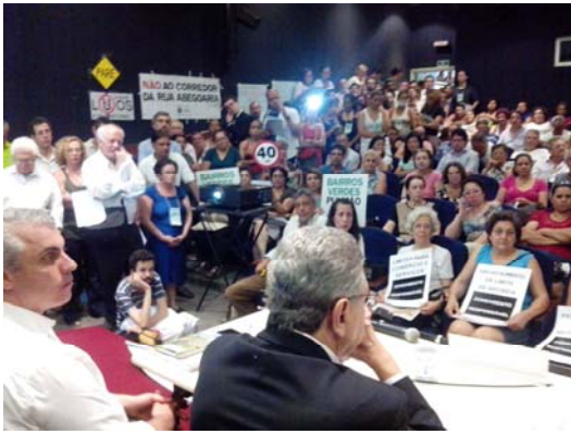
Durante audiência pública sobre o Zoneamento na região da Lapa.