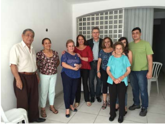
Com moradores do Parque São Domingos.