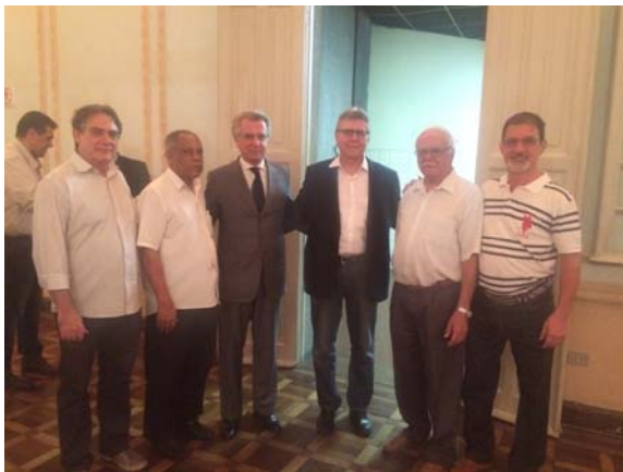
Presente nas comemorações do aniversário de 425 anos do bairro da Lapa.