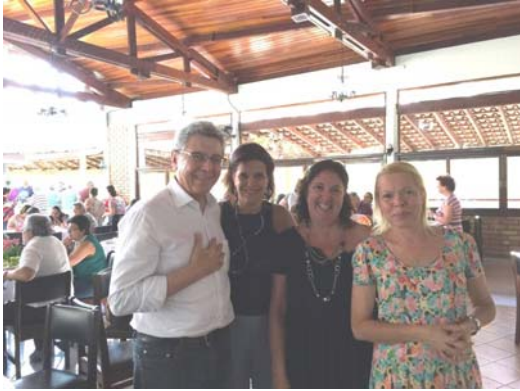
Prestigiando a “paella” beneficente para o Lar Abrigo Alvorada e para a Casa da Esperança.