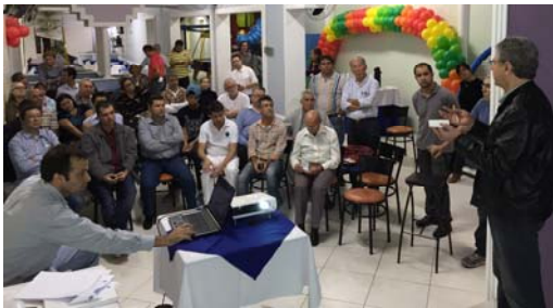
Com comerciantes e empresários da Avenida Anastácio.