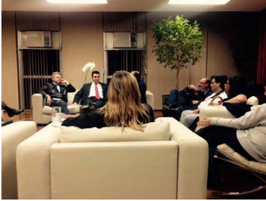
Em reunião com os moradores de vilas e ruas sem saída para discutirmos a recolocação de portões.