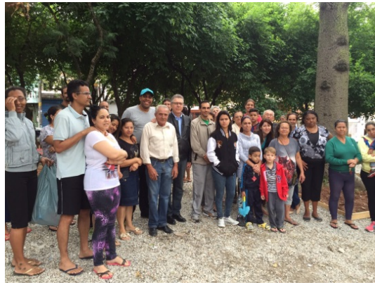
Revitalização da Praça Padre Antônio Carlos Barbosa Pinho, no Jardim Cidade Pirituba.