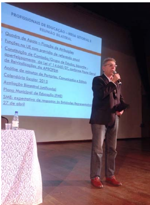
Na reunião da Aprofem (Sindicato dos Professores e Funcionários Municipais de São Paulo, falando sobre o PME (Plano Municipal de Educação).