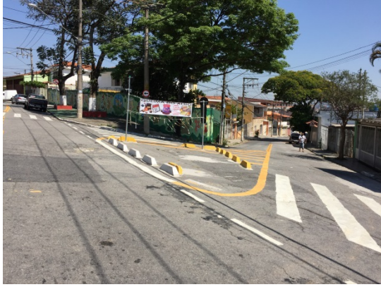
Construção de rotatória na Rua Avelino Ginjo, esquina com Eliseu Rodrigues de Almeida, na Vila dos Remédios.