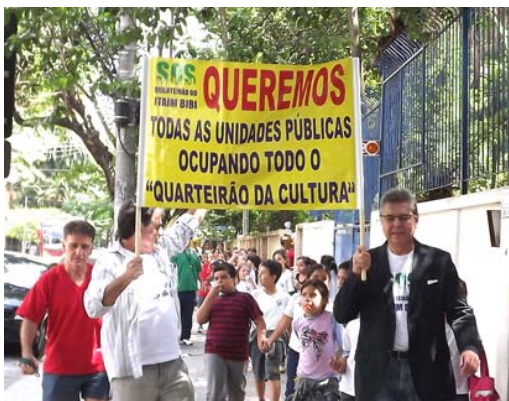
Proposta de sua autoria preserva definitivamente o Quarteirão Cultural do Itaim Bibi.