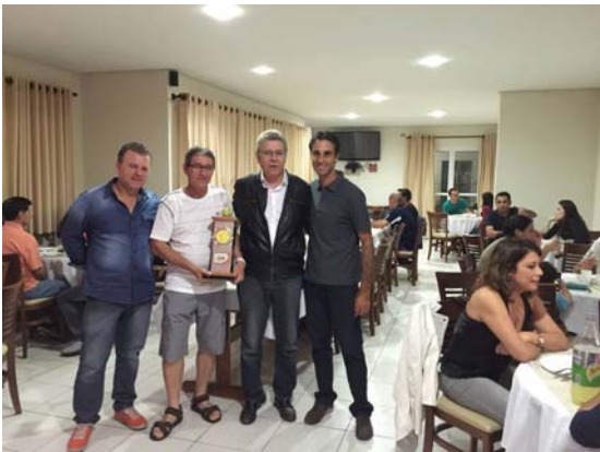
Apoio ao 6º Pirituba Open de Tênis, torneio que acontece no Parque Jacinto Alberto (Jardim Cidade Pirituba) e reúne mais de 60 atletas de diversos bairros da cidade.