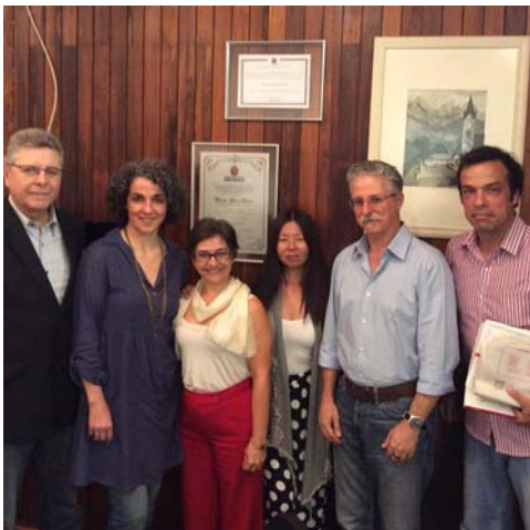
Com o Movimento Preservação Sumarezinho e da Vila Madalena, discutindo propostas para o zoneamento local, inclusive para evitar um possível adensamento da região

Conheça todas as propostas que o vereador Eliseu Gabriel apresentou para o novo Zoneamento – www.eliseugabriel.com.br