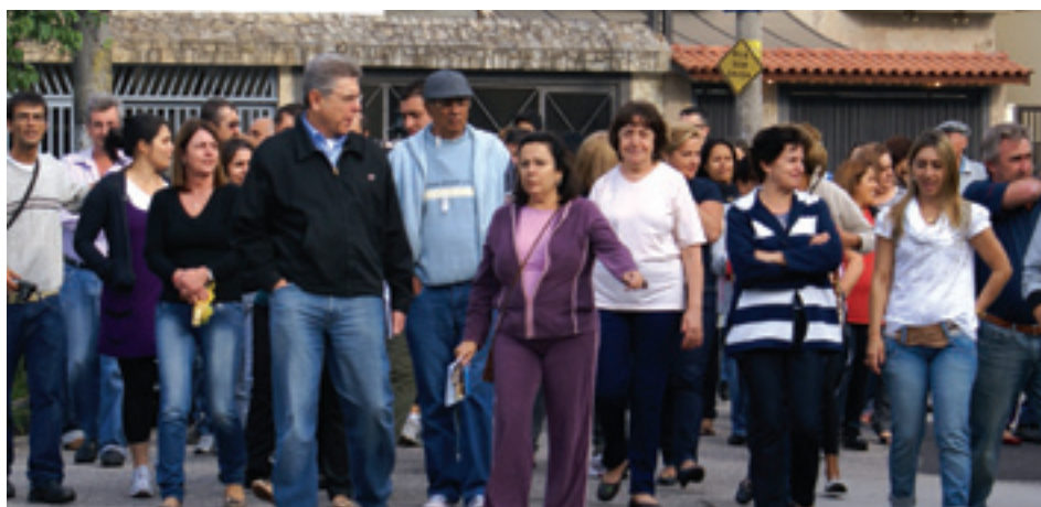
Vereador participa de manifestação com moradores da City Pinheirinho

O bairro conhecido como City Pinheirinho, que fica nas imediações do futuro empreendimento, poderia desaparecer. Porém, após intensa mobilização da comunidade e permanente atuação do