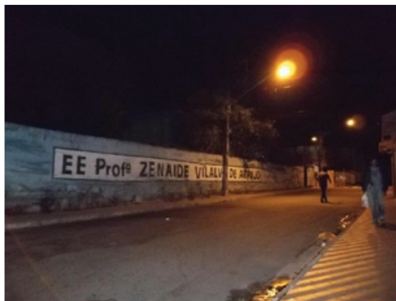
O entorno da EE Zenaide Vilalva ganhou nova iluminação