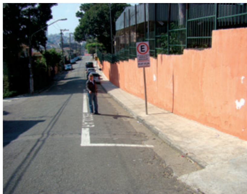
Sinalização de ruas em frente a EMEI Olga Calil Menah