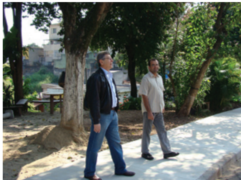
Eliseu confere nova calçada da EE Prof. Silvio Xavier Antunes

Você também pode solicitar ajuda ao gabinete do vereador.