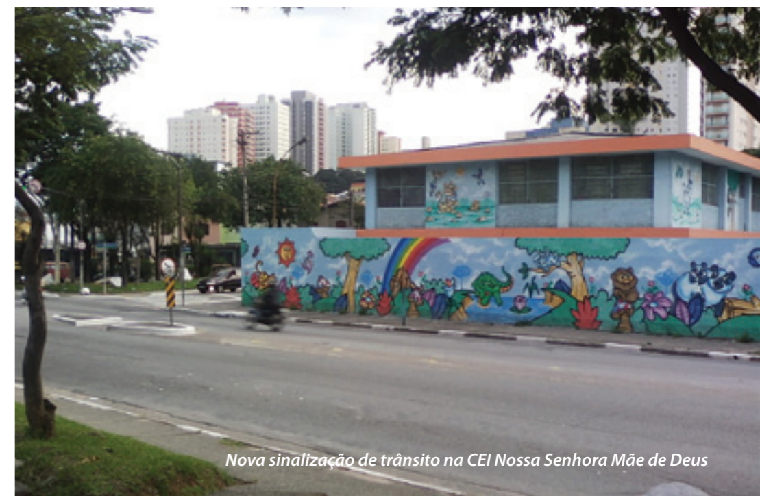
Nova sinalização de trânsito na CEI Nossa Senhora Mãe de Deus